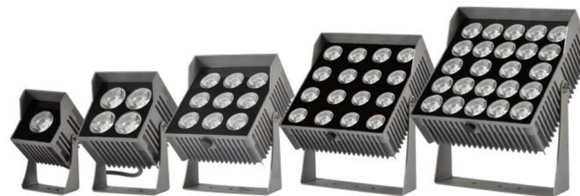
YY-YSG-YG03 YY-YSG-YG12 YY-YSG-YG27 YY-YSG-YG48 YY-YSG-YG72